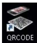
Fig.2 Icona avvio programma

Ad Installazione terminata verrà aperto automaticamente il programma; in caso contrario, cliccare sul pulsante denominato “QR Code Free” (fig.2)