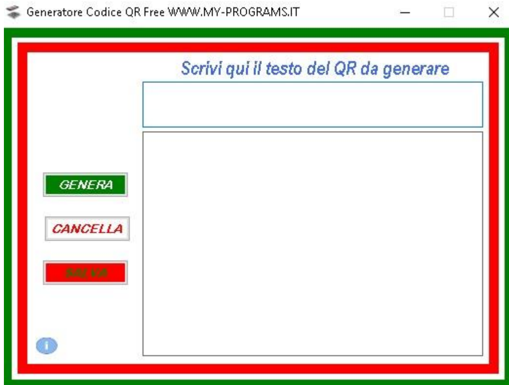
Fig. 3 Schermata Software

Avviato il programma si avrà la schermata iniziale come quella mostrata. (fig. 3)